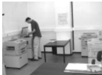
Produkte und Preise im Copy-Shop GA (ohne Gewähr)