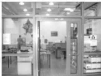
Produkte und Preise im Copy-Shop GB (ohne Gewähr)